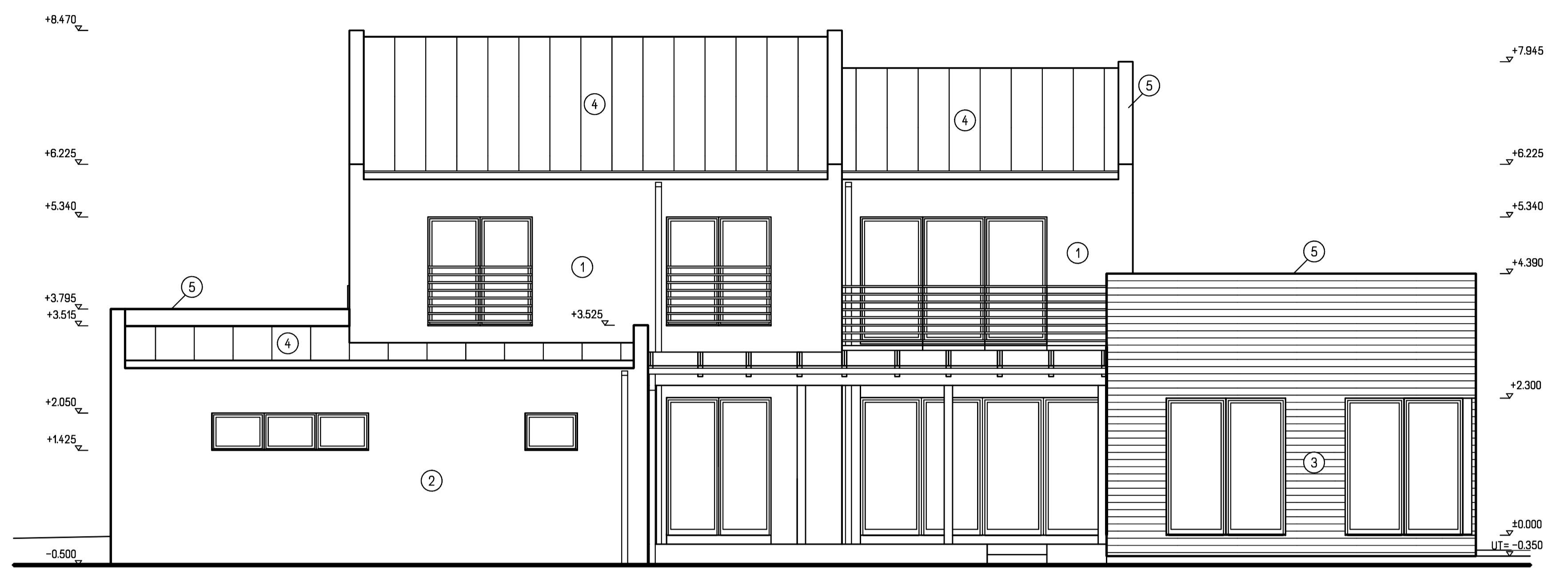
POHLED BOČNÍ - VÝCHODNÍ