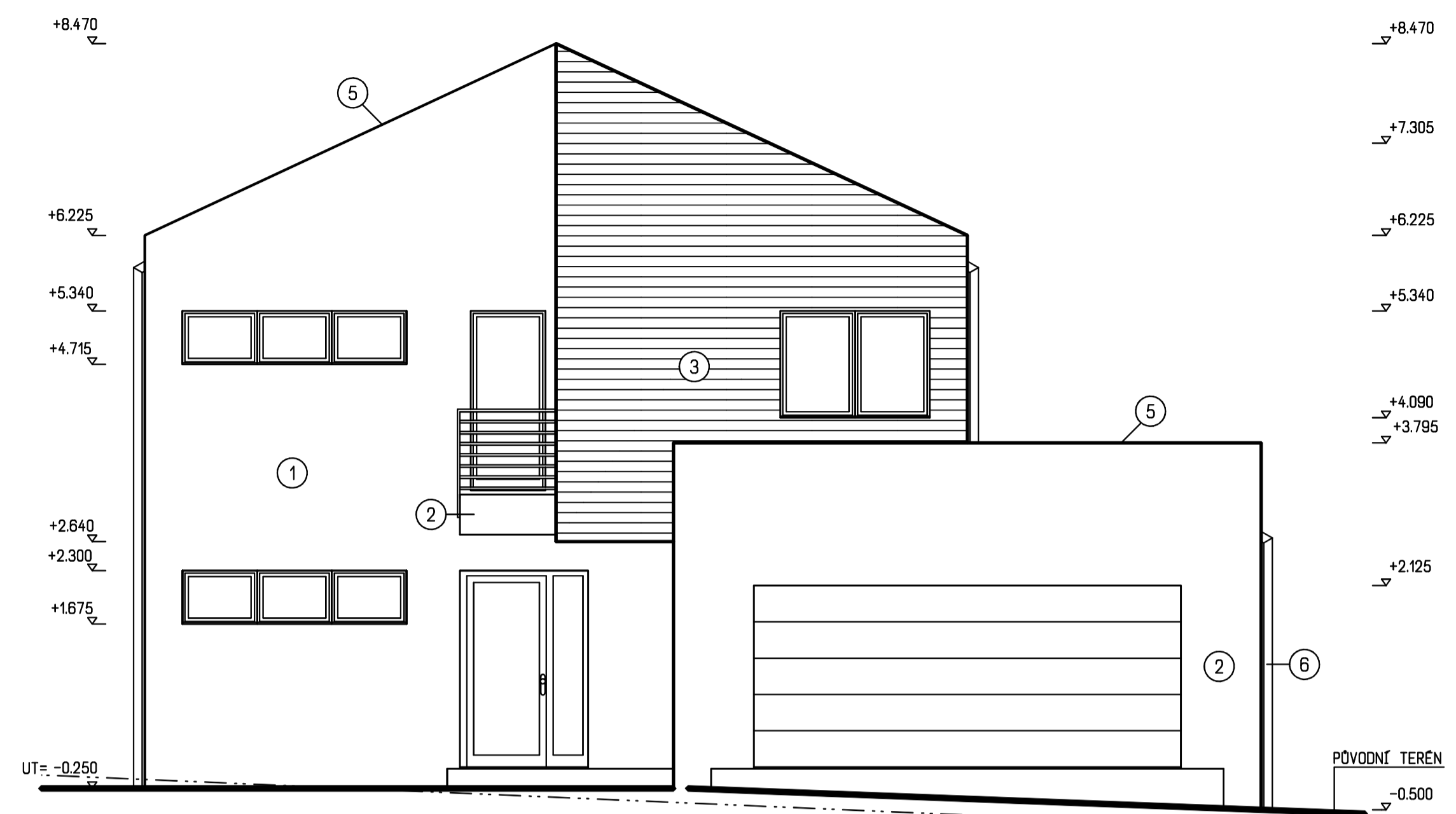
POHLED ČELNÍ - JIŽNÍ